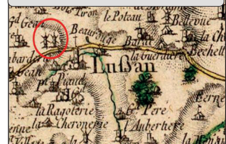
Carte de Cassini 1756-1789

Leur usage se généralise en Europe dès le XIIème siècle et une carte de Cassini établie entre 1756 et 1789 montre 5 moulins à vent sur le territoire de la commune de Lussant, dont 2 sur le site de Crolard.